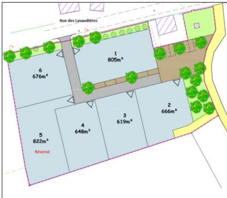
Schéma d'aménagement du lotissement

Afin de restaurer le mur existant le long de ce hameau et de valoriser le patrimoine présent, le chantier d'insertion d'ADALEA a été mandaté pour réaliser les travaux.